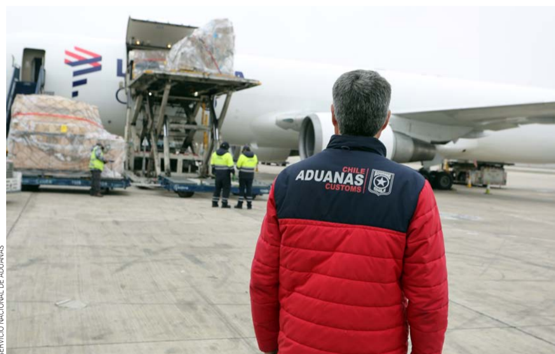
En este período, el Servicio Nacional de Aduanas destaca la modernización y digitalización de sus formas de atender a los usuarios.

Y, como toda crisis, por supuesto también hemos encontrado tremendas oportunidades, especialmente en la modernización y digitalización de nuestros procesos y formas de atender a los usuarios, algo que ha sido agradecido constantemente por las empresas y gremios que las agrupan.